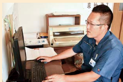
事務仕事もテキパキとこなします