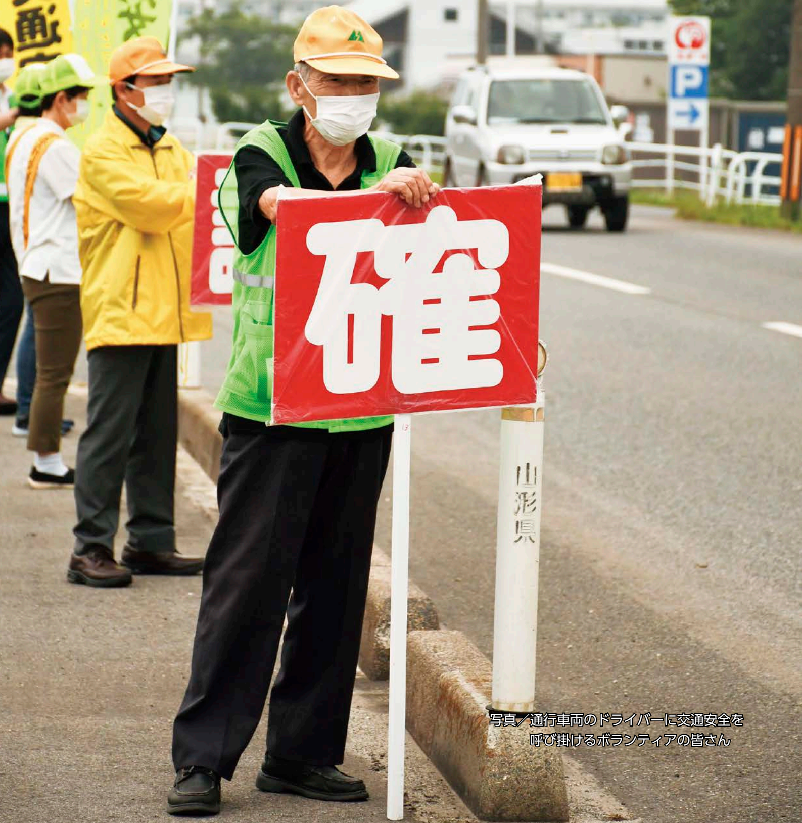
写真/通行車両のドライバーに交通安全を 呼び掛けるボランティアの皆さん