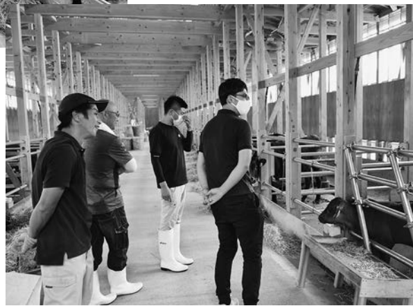
常に情報交換をしながら畜産経営を行っています