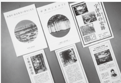
パンフレットとリーフレット

現在、町内各所には多くの文化財があります。この文化財を調べていくと、現在の生活につながる小さな歴史の物語が見えてきます。例えば、飯豊町を代表する文化財「天養寺観音堂」の周辺には多数の文化財があり、それらを調べていくと「天養寺史跡とホトケヤマ」の歴史の物語が見えてきます。このような歴史の物語を知り、そこにある文化財を訪ねることができるよう作成したのがリーフレットです。現在リーフレットは「天養寺観音堂」、「十三峠(街道と宇津峠)」、「飯豊山の穴堰」の三種類ができています。次に小さな物語を束ねていくと、以前お話した飯豊町の三つの文化圏が姿を現します。この文化圏も大きな物語を有しています。この物語を記したのがパンフレットで「散居集落の歴史と文化」、「中津川ジオサイト」、「宇津峠の史跡」の三冊ができています。手にした方が文化財の価値を感じることができるよう、これらのパンフレットとリーフレットでは多くの文化財を紹介しています。文化財の価値を感じる人がいなくては「日常的パトロール」は成り立ちません。パンフレットとリーフレットは、多くの人の歴史の物語と文化財を知り、その価値を感じてもらうためのものなのです。