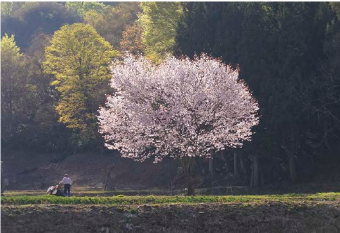
春風にのせて 岩谷秀夫さん（南陽市） 撮影地／岩倉