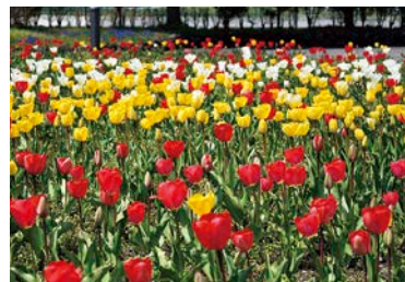
あ～す前のチューリップ・・・椿地区