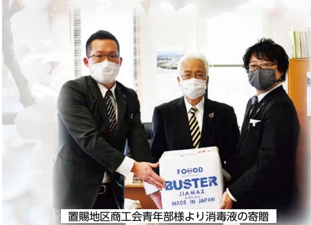
置賜地区商工会青年部様より消毒液の寄贈