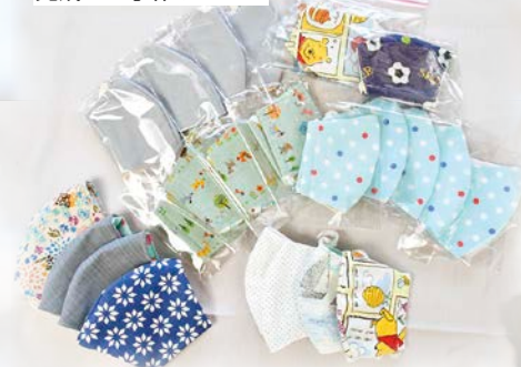
完成した手作りマスク

新型コロナウイルス感染拡大に伴うマスク不足の中、町内の女性有志らからボランティアで、町内の園児と小中学生、教職員へ手作りマスクが贈られました。 ボランティアの皆さんは、学年や体の大きさに合わせてサイズや柄を変えて製作し、「子どもたちの顔やマスクをしている姿を思い浮かべながら作っています」と