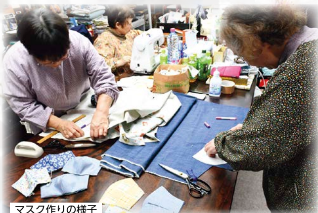
マスク作りの様子