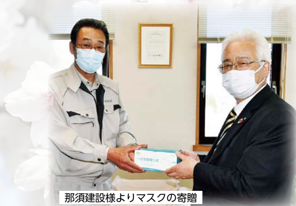
那須建設様よりマスクの寄贈