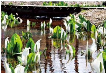
水芭蕉群生地・・・添川地区