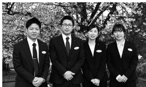
令和2年度新規採用職員