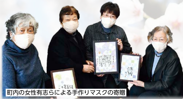
町内の女性有志らによる手作りマスクの寄贈