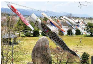
松原文殊堂前の鯉のぼり・・・松原地区