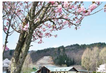
どんでん平ゆり園前の桜・・・萩生地区