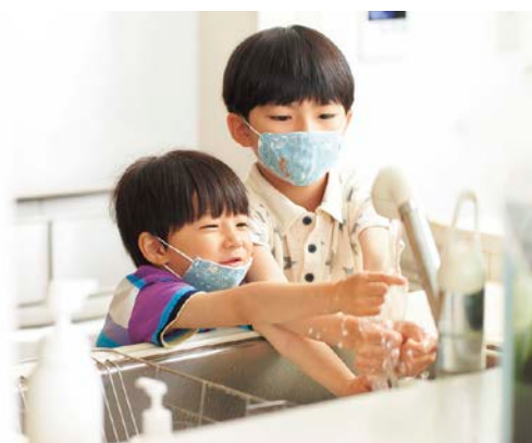
「3密」を避け、手洗いの励行などできる対策を

一方で、消費生活に与える影響として、マスクが手に入りにくくなったり、SNS等による情報拡散による不安から、トイレットペーパーが一時品薄になるなどの騒動がありました。長引く自粛要請や、慣れない家庭でのリモートワーク、自分がいつ感染するかわからない等の不安心理からストレスを抱える方も増えています。そうしたことから、家庭内でのDVや特定の業種への偏見や差別、嫌がらせなど、コロナウイルス感染症が2次的な被害をもたらしている現状があります。