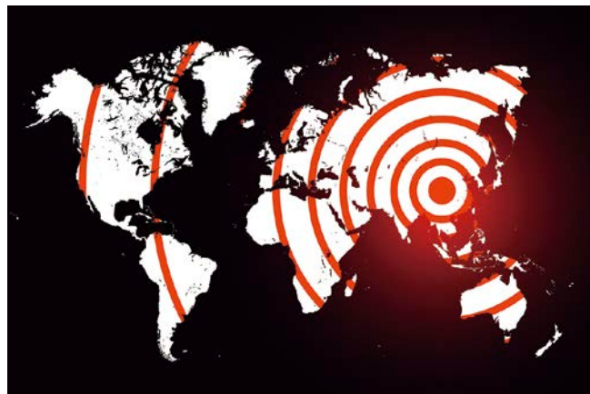
新型コロナウイルスは4カ月で全世界に流行が拡大

世界がより深く広く結びついたことで、人やモノの往来が盛んになった一方、一つのリスクが世界全体に大きな影響を及ぼしかねない危険性が顕在化し、持続可能性そのものが危うくなることが懸念されています。