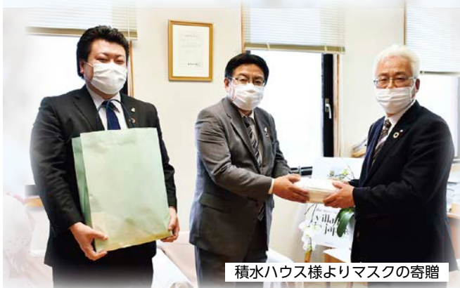
積水ハウス様よりマスクの寄贈

おっしゃっていました。 新型コロナウイルス感染拡大防止のため休校が続いていましたが、5月13日より始まった学校生活では手作りマスクをして歩く姿を見ることができました。 また、各事業者様からもマスクや消毒液など町への温かいご支援が寄せられました。今後、福祉施設等で活用させていただきます。