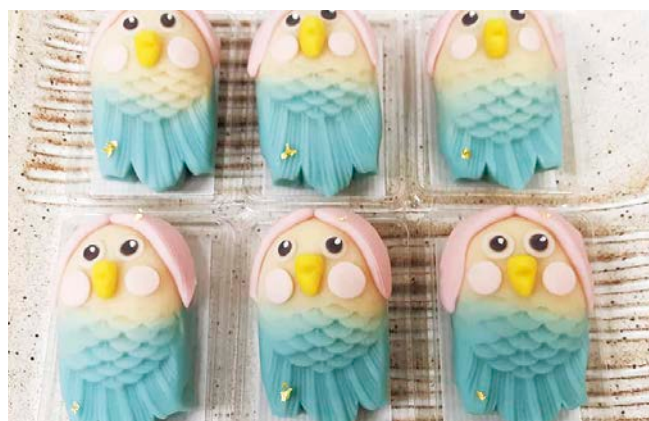
上生菓子で作られた香月の「疫病退散アマビエ様」

光が見え始めたコロナウイルス終息後の世界に向け、私たち自身の持続可能な社会や、暮らしの在り方が今まさに問われています。