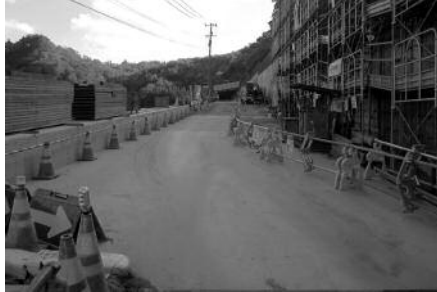
中津川方面を望む

なお、通行の安全を確保するため、やむを得ず一時的（数分間）に通行できない時間も生じますが、皆さまのご理解とご協力をよろしくお願いいたします。