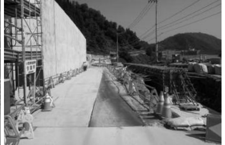
手ノ子方面を望む