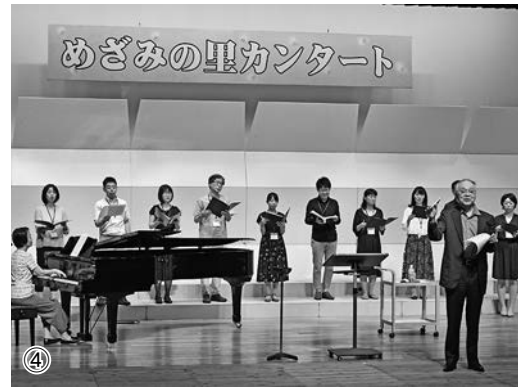
①心をひとつに歌い上げた全員合唱 ②公開レッスンを受ける合唱団 ③栗友会合唱団による演奏 ④馴染みのある歌「夏は来ぬ」「夏の思い出」を歌う参加者