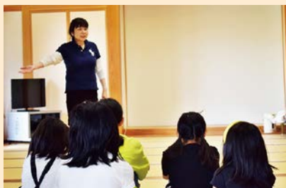
「季節のおはなし 読み聞かせ」での説明