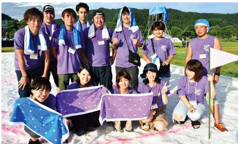
大場実行委員長（前列中央）と実行委員の皆さん