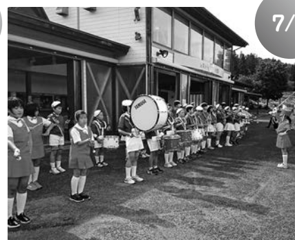
第一小学校トランペット鼓隊 ゆり園パレード (ゆり園)