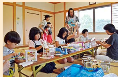
地域の方と一緒にランタンづくり