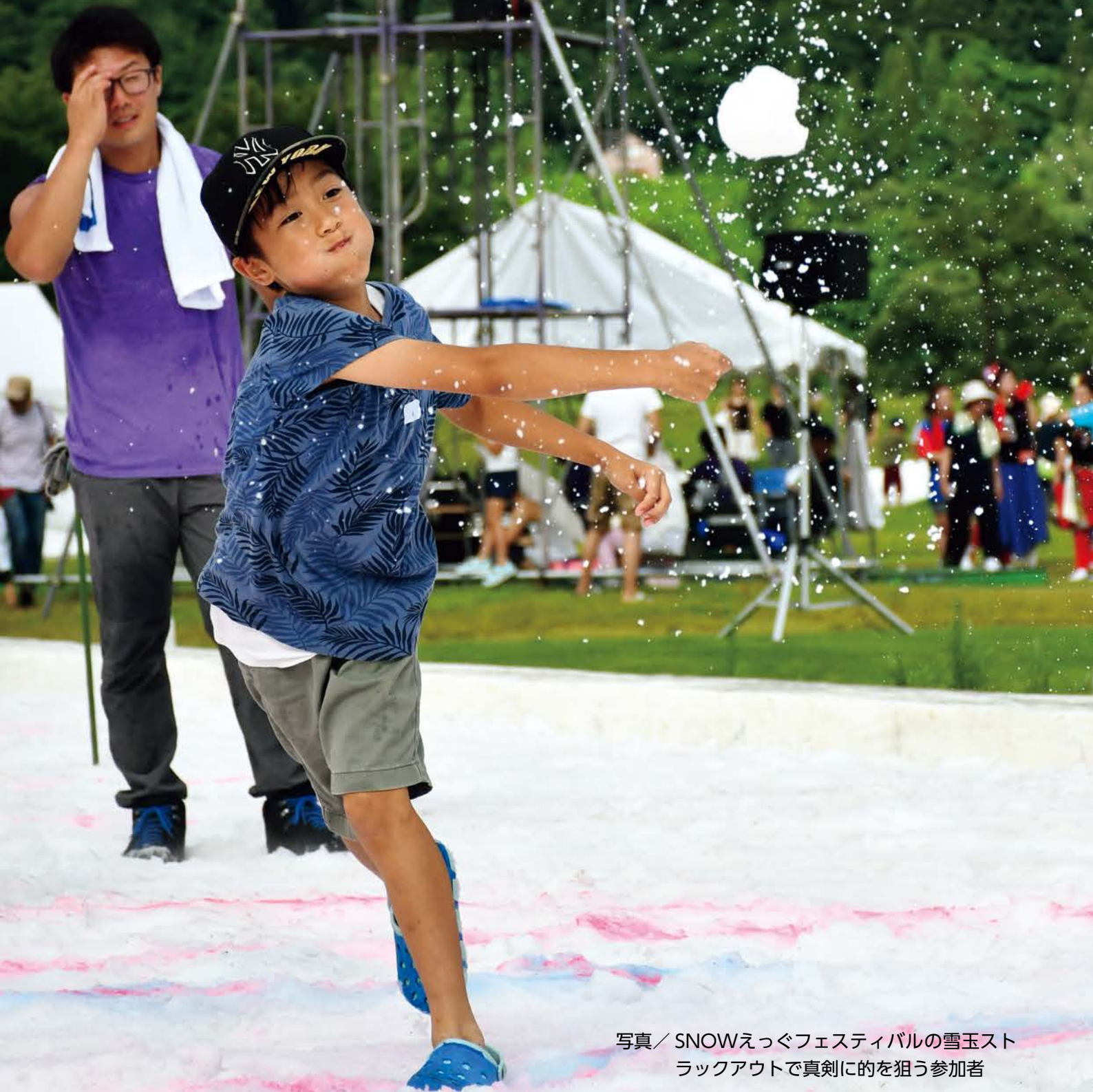
写真 / SNOWえっぐフェスティバルの雪玉ストラックアウトで真剣に的を狙う参加者