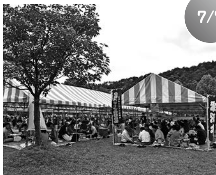
第31回いいで黒べこ祭り (ゆり園)