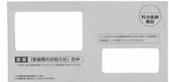
お知らせの封筒（薄い青）