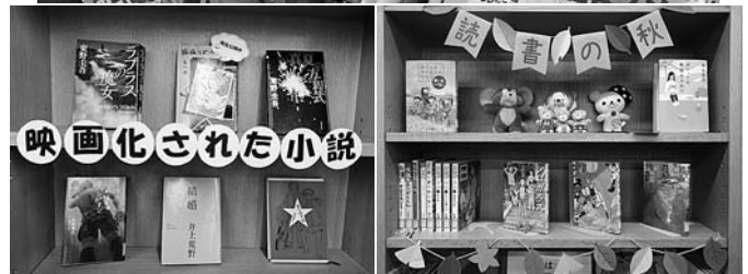
趣味の本や話題の本を集めたコーナー