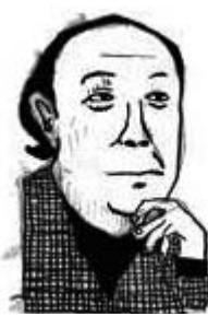
作曲家 池辺晋一郎