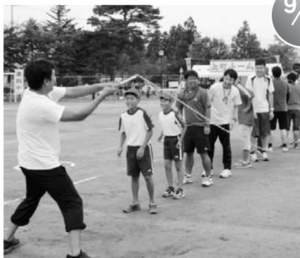
添川小・東部地区合同大運動会 (添川小学校)