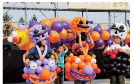
帽子も服も芋虫もみんな風船「バルーンアート」