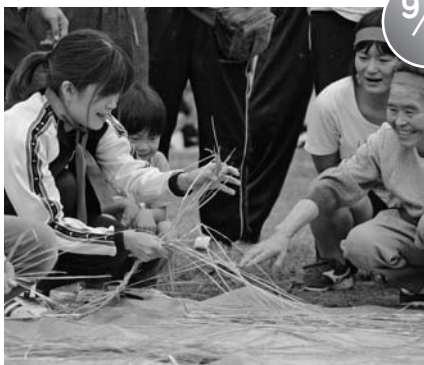
中津川地区大運動会 (旧中津川小中学校)

9月11日、あ～すで、こどもみらい館主催の「夢きらら元気っ子広場」が行われ、町内幼児施設の園児とみらい館利用者など約200名が、腹話術や人形劇を鑑賞しました。生き生きとした人形たちの動きに子どもたちの姿勢は自然と前のめり。人形劇「3びきのやぎのがらがらどん」の怪物がヤギに近寄ってくるシーンでは、「くるよ」「うしろ、うしろ」と、一生懸命ヤギに呼びかける子どもたちもいました。