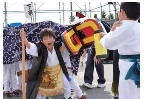
迫力と愛らしさの「ちびっこ獅子」