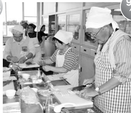
町食改主催「男の料理教室」 (健康福祉センター)