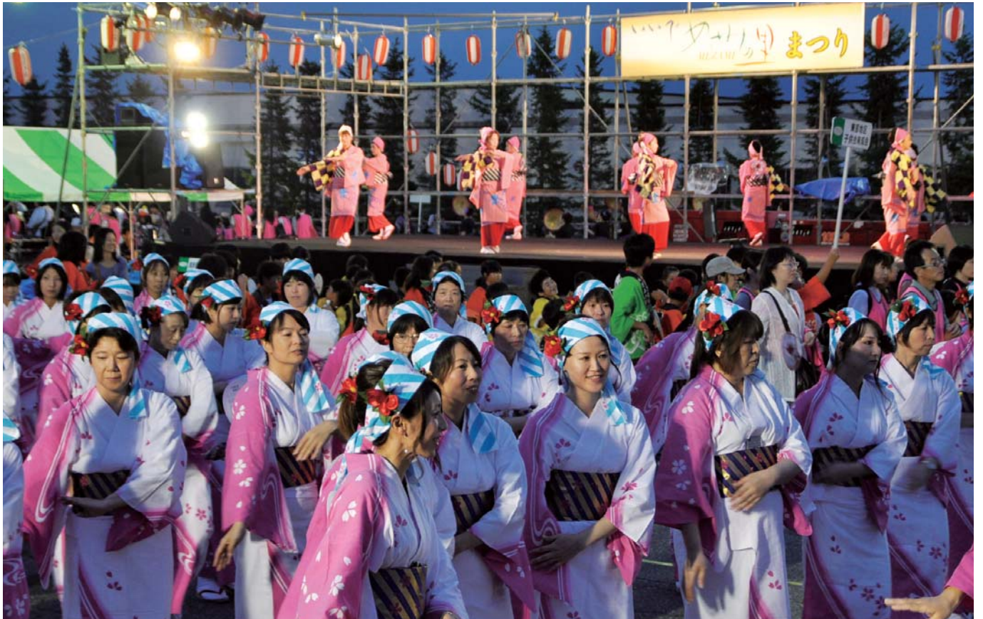
あでやかに舞い踊る「めざみの里WA踊り」