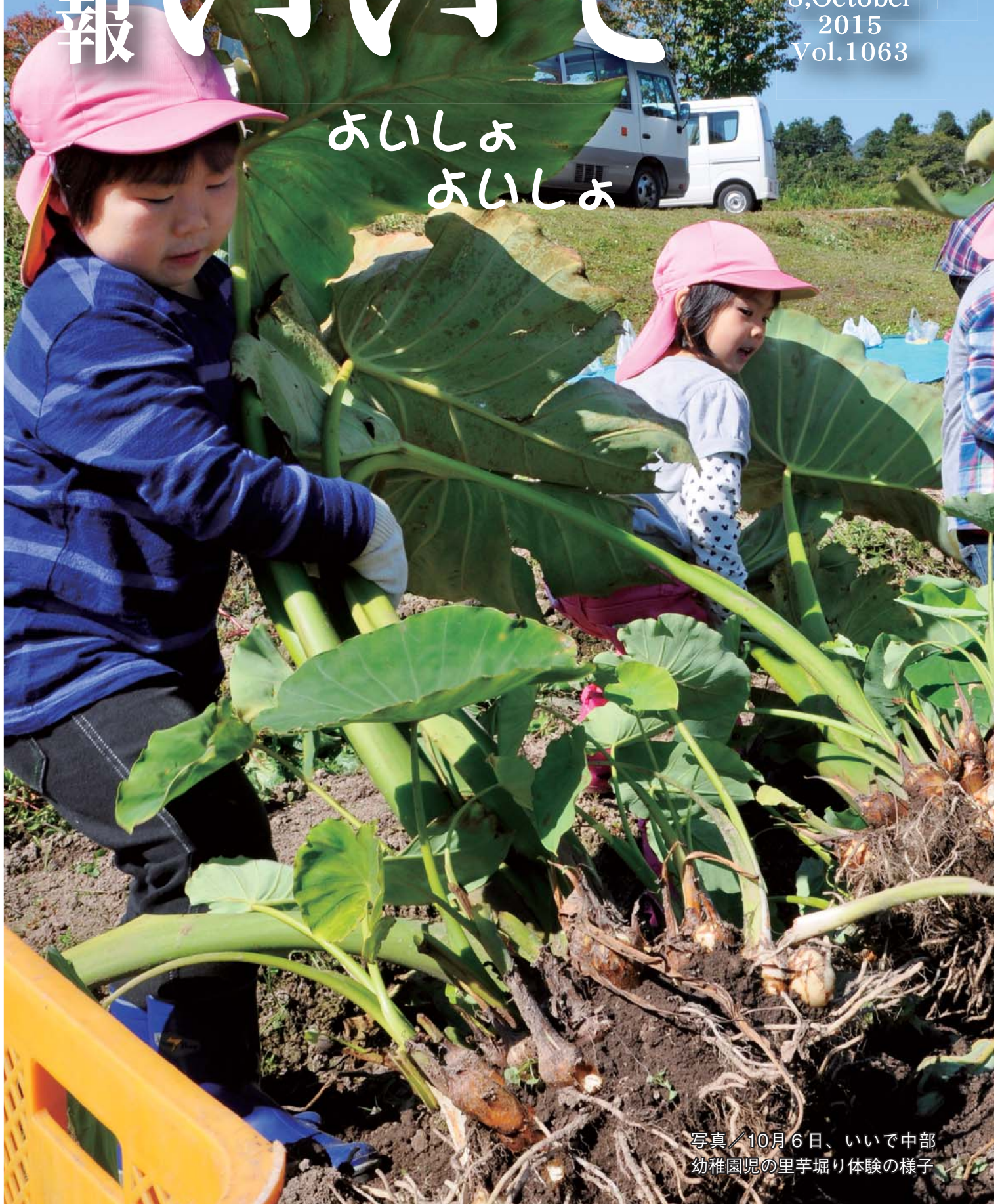
写真 / 10月6日、いいいで中部 幼稚園児の里芋堀り体験の様子