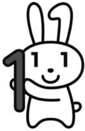
マイナンバー制度キャラクター 愛称「マイナちゃん」