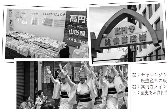
左：チャレンジショップでの飯豊産米の販売 右：高円寺メインストリート 下：歴史ある高円寺阿波おどり

◆申込・問合せ先／にぎわい再現プロジェクト委員会事務局【町民総合センター「あ～す」内】 〒999-0604 飯豊町大字椿3622番地 ☎72-3111 FAX72-3163 ✉i-asu@town.iide.yamagata.jp