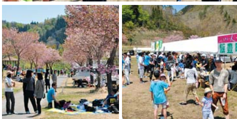
桜咲き残る湖岸公園内