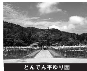
どんでん平ゆり園

総入園者数29,876名（対前年比7.1%減）、売上高は約4,358万円、当期純利益は13万円、繰越利益剰余金はマイナス1,023万円となりました。