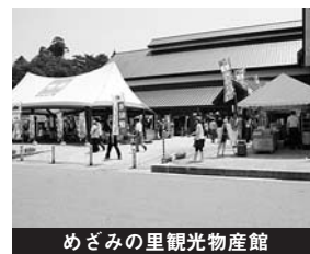
めざみの里観光物産館

来館者数は約44万人（対前年比2.2%減）、売上高は約5億9,808万円（対前年比2.7%増）、当期純利益は114万円、繰越利益剰余金は929万円となりました。