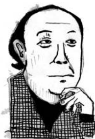
作曲家 池辺晋一郎