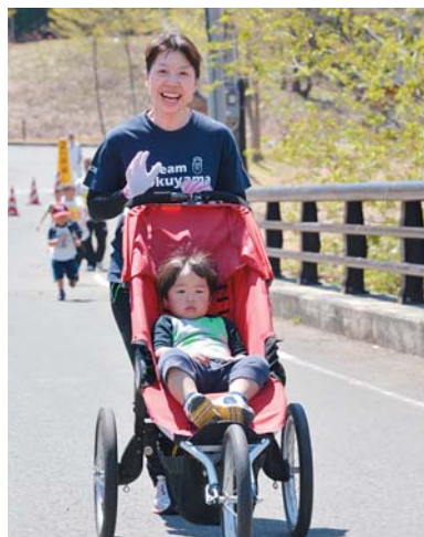
マラソンの楽しみ方はランナーそれぞれ