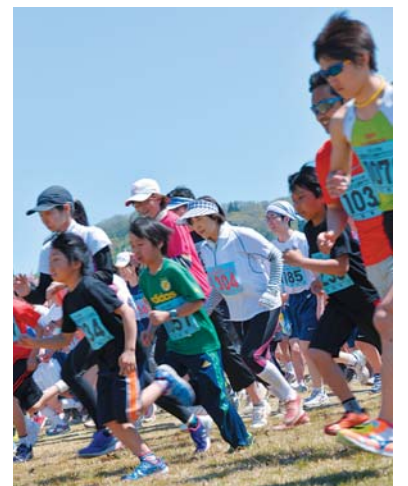
号砲の合図で一斉にスタート