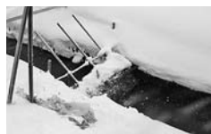
せき止めた農業用排水路には、大量の生活ごみがひっかかった