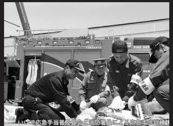
いいで応急手当普及員と消防署員による応急手当訓練