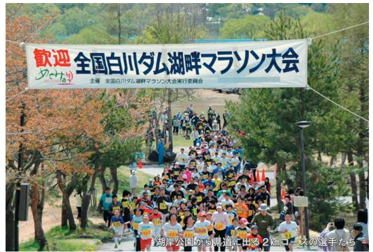
湖岸公園から県道に出る2kmコースの選手たち

雪、桜、新緑を見ながら気持ちよく走ることができました。特に橋の上（十四郷荘付近）からの景色は最高です。圧倒的な自然のボリュームと豊かな色に感動しています。昨日から飯豊町で過ごしていますが、元気な子供たちとユーモアあふれる大会スタッフの方と一緒にいると心がほっこりしてきます。素敵なお笑顔でゴールするランナーを見ているとこの大会の和やかさが伝わってきました。楽しい大会に参加できてとても幸せです。