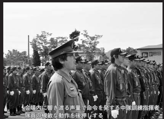
会場内に響き渡る声量で命令を発する中隊訓練指揮者 隊員の機敏な動作を後押しする