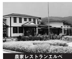
農家レストランエルベ

大震災以降の自粛ムードにより大変厳しい状況下での経営となりましたが、従業員一同でサービス向上と経営改善に取り組んだ結果、売上高は、約4,234万円(対前年比33.5%の増)となりました。当期純利益は247万円、繰越利益剰余金はマイナス458万円となりました。