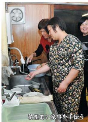
積極的に家事を手伝う