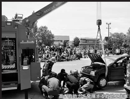
高い救助力を発揮する救助工作車