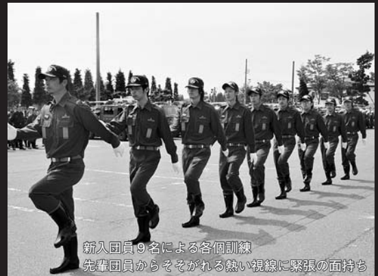
新入団員9名による各個訓練 先輩団員からそそがれる熱い視線に緊張の面持ち