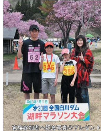
家族参加者へ記念写真のプレゼント