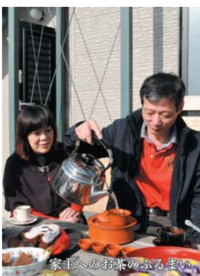
家主へのお茶のふるまい