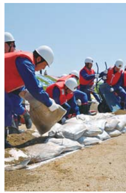
積土のう工を披露する消防団。 炎天下の中、ライフジャケットを着ての作業で額に汗がにじむ。

消防団は火災時の消火活動のみならず、台風や地震などの住民の生命、身体、財産を脅かすあらゆる災害に対処する団体です。