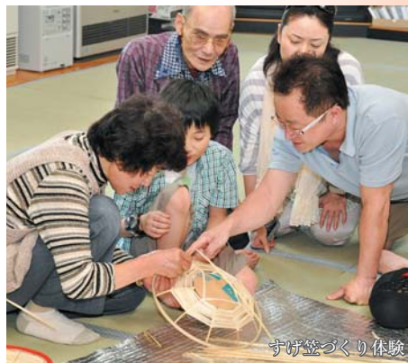
すげ笠づくり体験