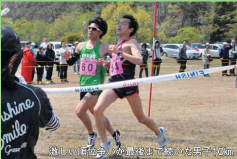
激しい順位争いが最後まで続いた男子10km