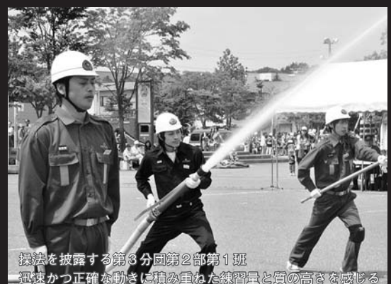
操法を披露する第3分団第2部第1班 迅速かつ正確な動きに積み重ねた練習量と質の高さを感じる