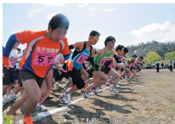
一歩でも前に。10kmコースのスタート