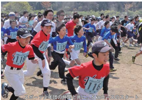
スポーツ少年団の仲間と共に。5kmコースのスタート

ランナーたちは桜やスイセンが咲く中、思い思いの走りを楽しみました。閉会式では、町内温泉施設の宿泊券などが当たる抽選会が行われ、会場は最後まで大いに盛り上がりました。