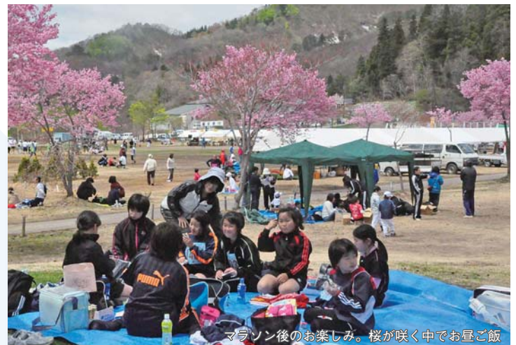
マラソン後のお楽しみ。桜が咲く中でお昼ご飯