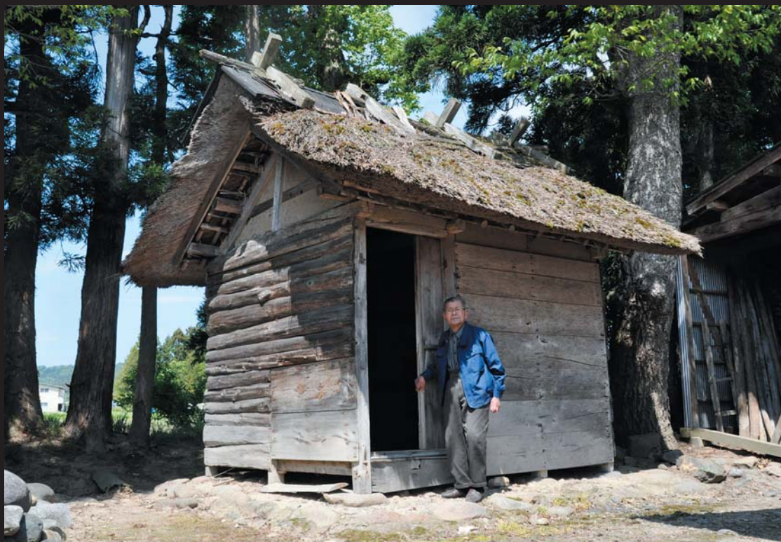
写真/面積2.22坪。建築様式は折置組方式。各部材はハンノキを使用し、屋根は茅葺。中は板敷きになっている。

文化財は、郷土の歴史、民俗、信仰、自然を物語る町の宝。継承し守り続けている人たちがいるから輝く価値がある。