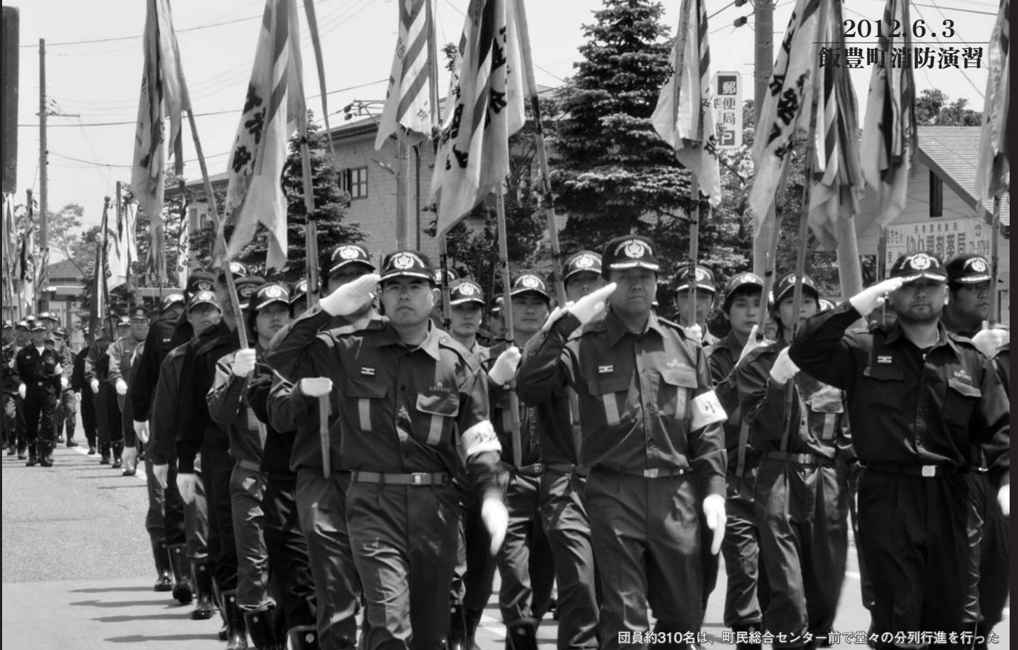
団員約310名は、町民総合センター前で堂々の分列行進を行った