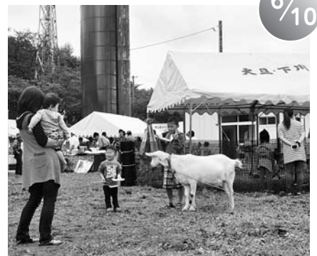
飯豊公園パークゴルフ場オープニング記念競技(飯豊公園)