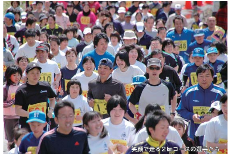
笑顔で走る2kmコースの選手たち