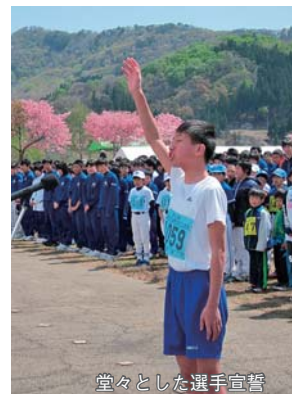
堂々とした選手宣誓