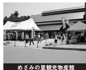
めざみの里観光物産館

東日本大震災の影響により、集客の柱の一つである観光バスのキャンセルが相次ぎ、開館以来記録的な入館者減となる極めて厳しい1年となりました。来館客数は約44万人(対前年比8.6%の減)、売上高は約5億7,443万円(対前年比9.0%の減)となりました。当期純利益は66万円、繰越利益剰余金は732万円となりました。