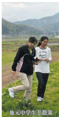
地元中学生と散策

☆参加者の多くが日本のテレビ番組(有名人が田舎の一般家庭に泊まる内容)を台湾で見ている。