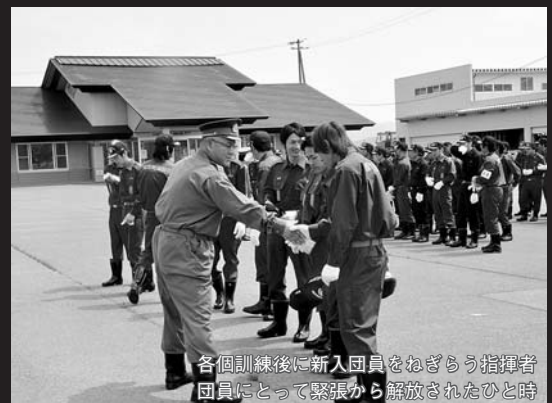
各個訓練後に新入団員をねぎらう指揮者 団員にとって緊張から解放されたひととき