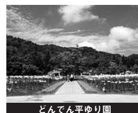
どんでん平ゆり園

大雪の影響によりユリの生育が遅れ、最盛期は7月10日過ぎとなりました。大震災からの復興特別企画として小・中学生の入園料を無料としました。また、スーパーすべり台設置を機に家族客の誘客活動などを行いました。しかし、大震災の影響で来園者数は減少し27,060人(対前年比22.2%の減)。当期純利益は330万円、繰越利益剰余金はマイナス1,671万円となりました。