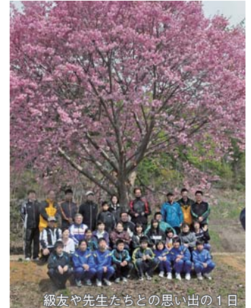
級友や先生たちとの思い出の1日